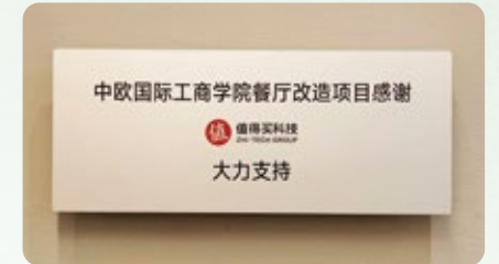
值得买支持北京校园改建项目