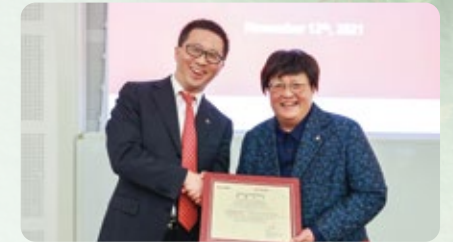
才金资本捐赠仪式

HEMBA2019 级班级捐赠人民币 55.3 万元 ，与 HEMBA2018 级共计捐赠人民币 161.8 万元 ，共同冠名 HEMBA 教室