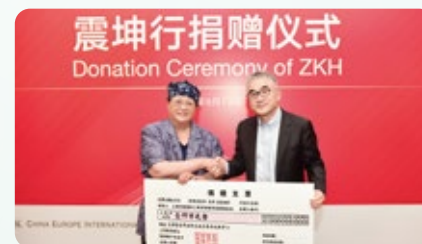
中欧 - 震坤行供应链与服务创新中心冠名捐赠仪式

三家校友企业及中欧创二代私董会捐赠人民币 251 万元 支持中欧家族传承研究中心