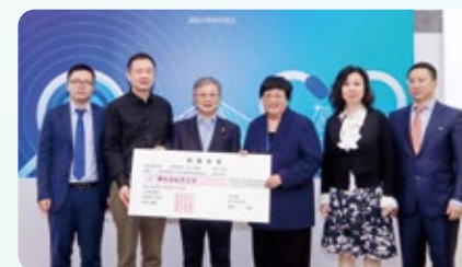
中欧智慧医疗研究院捐赠仪式