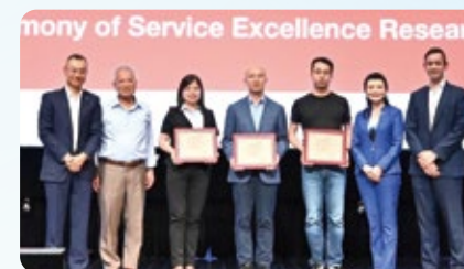
卓越服务研究领域捐赠仪式