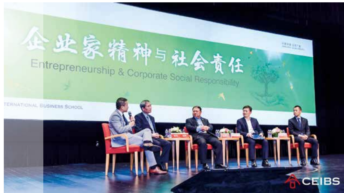
中欧校友返校日系列活动之“企业家精神与社会责任”主题论坛