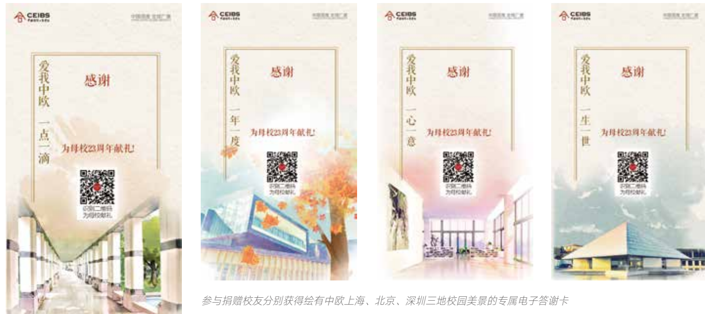
参与捐赠校友分别获得绘有中欧上海、北京、深圳三地校园美景的专属电子答谢卡

正是创始者们追求卓越的精神，让一群群有志青年的梦想从中欧起航；正是创始者们无私奉献的精神，将“责任”与“感恩”始终深刻烙印于中欧的文化之中。毕业不是结束，而是另一段新征程的开始。感怀在母校一起走过的同窗岁月；感恩母校的传道授业解惑；祝福母校继续朝着世界一流商学院的梦想迈进……责任与感恩，在中欧代代传承。