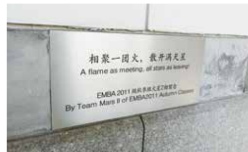
镶嵌于中欧上海校区廊柱上的 EMBA2011 级火星二组冠名铭牌

EMBA2011 级火星二组 13 名同学在第一个开学模块，共同捐赠人民币 130,000 元冠名上海校区廊柱一根，首创中欧历史上跨 3 地校区联名捐赠的先河。